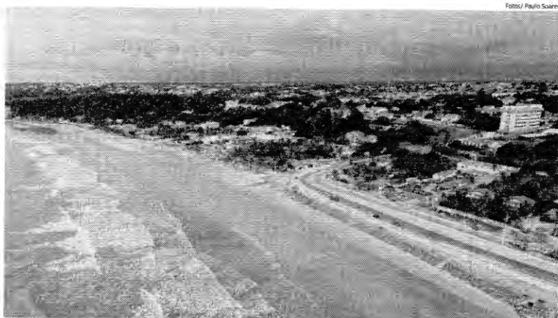
União executa plano de negócios que estima arrecadar valores com a remissão de foro; imóveis da orla do Olho d'Água pertencem à União

Entre as áreas mais conhecidas neste rol, está a chamada "Gleba do Rio Anil", que inclui desde a área da Ponta d'Areia até a Avenida São Luís Rei de França