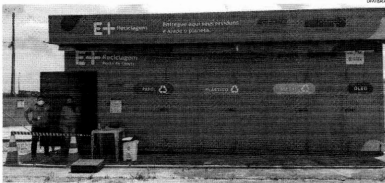
Novos postos de coleta de resíduos recicláveis estão espalhados na capital; ação proporciona desconto na conta de energia elétrica

O Maranhão já conta com 14 postos de coleta fixos do projeto E+Reciclagem, uma iniciativa da empresa Equatorial Maranhão, com o objetivo incentivar a destinação correta de resíduos sólidos e proporcionar sustentabilidade. Os postos estão espalhados em São Luís (9), Imperatriz (3), Caxias (1) e Timon (1). Além de dar a destinação correta dos resíduos sólidos recicláveis e evitar que mais lixo seja descartado no meio ambiente, proporciona desconto na conta de energia, de acordo com a quantidade e tipo de material reciclável. O desconto pode ser aplicado na conta do cliente residencial ou ser doado a uma instituição filantrópica. Os postos estão abertos de segunda a sexta-feira, das 8h às 12h e das 13h às 17h, e aos sábados de 8h às 12h. Em São Luís, a troca dos materiais recicláveis pode ser feita nos postos do Centro Elétrico (Avenida Guajajaras), Supermercado Mateus (Cohab), Lagoa da Jansen, sede da Equatorial Maranhão (Altos do Calhau), Uema, Vila Embretel, Anil, Areinha e São Raimundo.