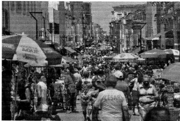
Lojas começaram a abrir uma hora mais tarde, mas movimentação de consumidores é intensa na Rua Grande